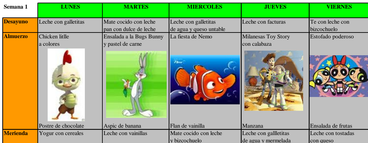
Tabla 3. Mosaico propuesto para el Jardín con dibujos animados.