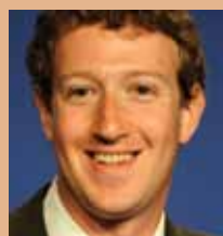
Mark Zuckerberg, Facebook

“No tiene por qué ser mucho, pero ofrecerle a la gente incluso una red de seguridad muy pequeña generaría un enorme espíritu emprendedor porque si uno no puede permitirse tomar riesgos, generalmente no correrá ningún riesgo”