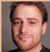
Stewart Butterfield, Slack

“No tiene por qué ser mucho, pero ofrecerle a la gente incluso una red de seguridad muy pequeña generaría un enorme espíritu emprendedor porque si uno no puede permitirse tomar riesgos, generalmente no correrá ningún riesgo”