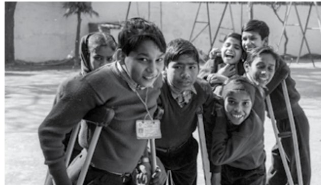
▲ Niños con secuelas de polio, Pakistán