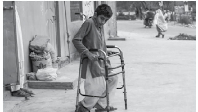
▲ La poliomielitis es una enfermedad muy contagiosa causada por un virus que afecta al sistema nervioso y puede causar parálisis en cuestión de horas