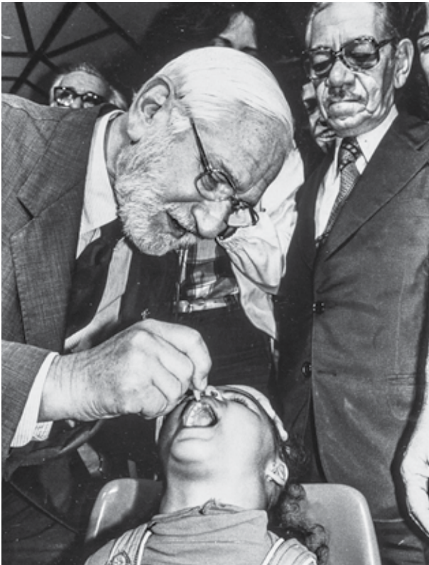
▲ En 1961 el Dr. Albert Sabin desarrolló una vacuna oral a virus vivos atenuados (OPV), que rápidamente se convirtió en la vacuna de elección para la mayoría de los programas de inmunización en el mundo