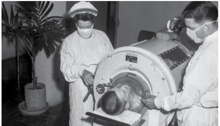
▲ Pulmón de acero o ventilador de presión negativa. Utilizado para personas afectadas por polio, que por la parálisis producida por la enfermedad, tenían dificultad para respirar y eran ubicadas en estas cámaras de acero para sobrevivir