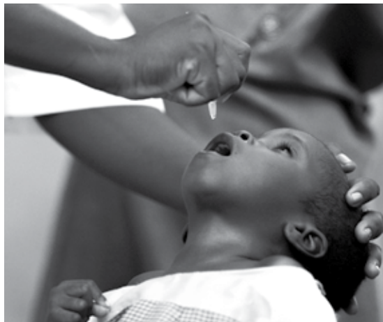
◀ Campaña de vacunación con la vacuna oral (OPV)