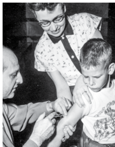
◀ Históricas inmunizaciones de vacuna inyectable (IPV) contra la polio