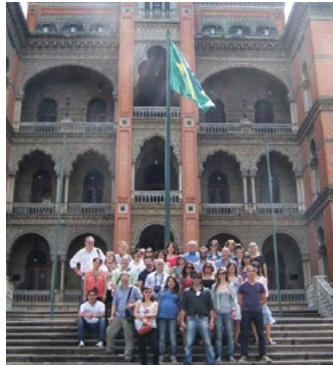
Río de Janeiro 2013 ►