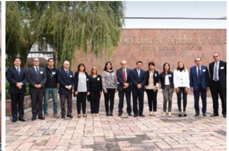
▲ México 2014