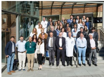
España (País Vasco) 2018 ►