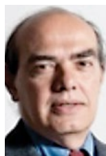
Por Arturo Schweiger y María Clara Zerbino

Desde hace 20 años, ISALUD lleva adelante cada año su módulo internacional para conocer in situ la economía, los sistemas y las organizaciones de salud en diferentes países del mundo, una auténtica experiencia transformadora para estudiantes de posgrado y docentes