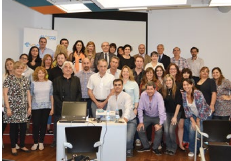
▲ España (Barcelona) 2016