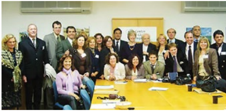
▲ Washington 2007