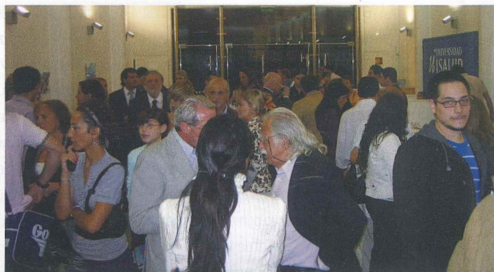
El Espacio de Arte de ISALUD, desbordado de gente el día de la inauguración