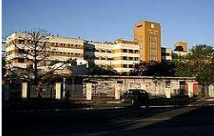
Servicio de Guardia

Las instalaciones del Hospital Santojanni ubicadas sobre Pilar 950 disponen de un eficiente servicio de guardias médicas las 24 horas para la atención de distintas urgencias.