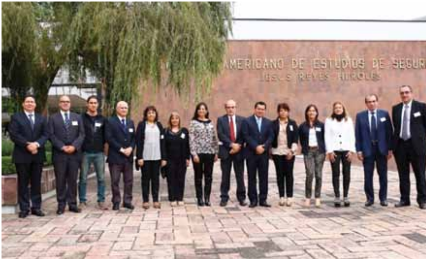
Comienzo del Módulo Internacional de la Universidad ISALUD, en el Centro Interamericano de Estudios de la Seguridad Social (Ciess), de México

y establecer niveles mínimos de protección social por parte de cada uno de los institutos de seguridad social en el marco de la Conferencia Interamericana de Seguridad Social.