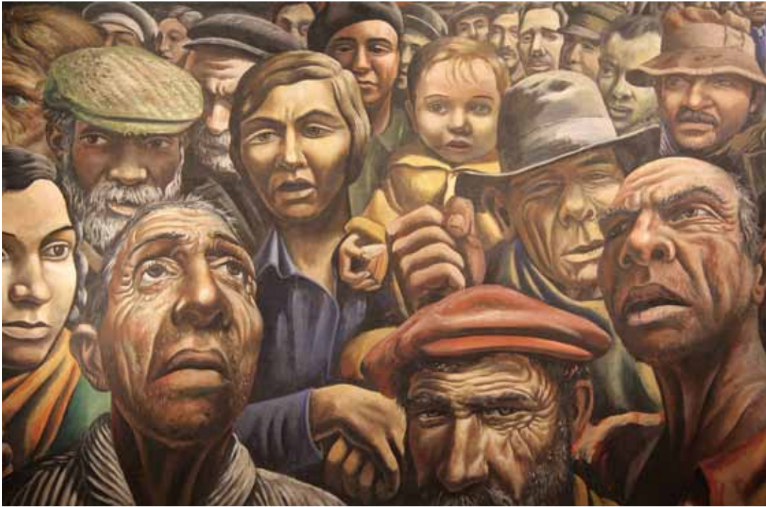
Manifestación, Antonio Berni, 1934

La salud global de nuestro tiempo demanda la participación articulada de variados actores, donde se incluyen los gobiernos, las organizaciones de la sociedad civil, fundaciones, instituciones académicas, el sector privado y organizaciones religiosas, entre otros.